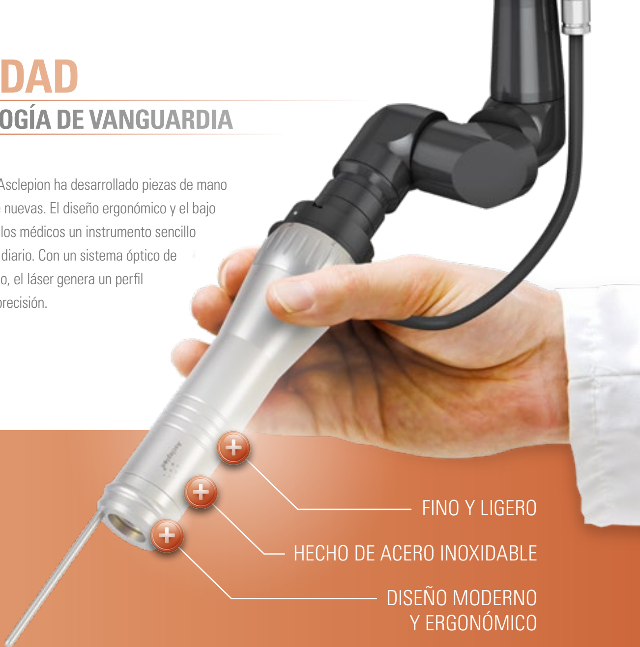
CABEZAL ZOOM ST

Con PicoStar®, Asclepion ha desarrollado piezas de mano completamente nuevas. El diseño ergonómico y el bajo peso ofrecen a los médicos un instrumento sencillo para su trabajo diario. Con un sistema óptico de desarrollo propio, el láser genera un perfil de haz de alta precisión.